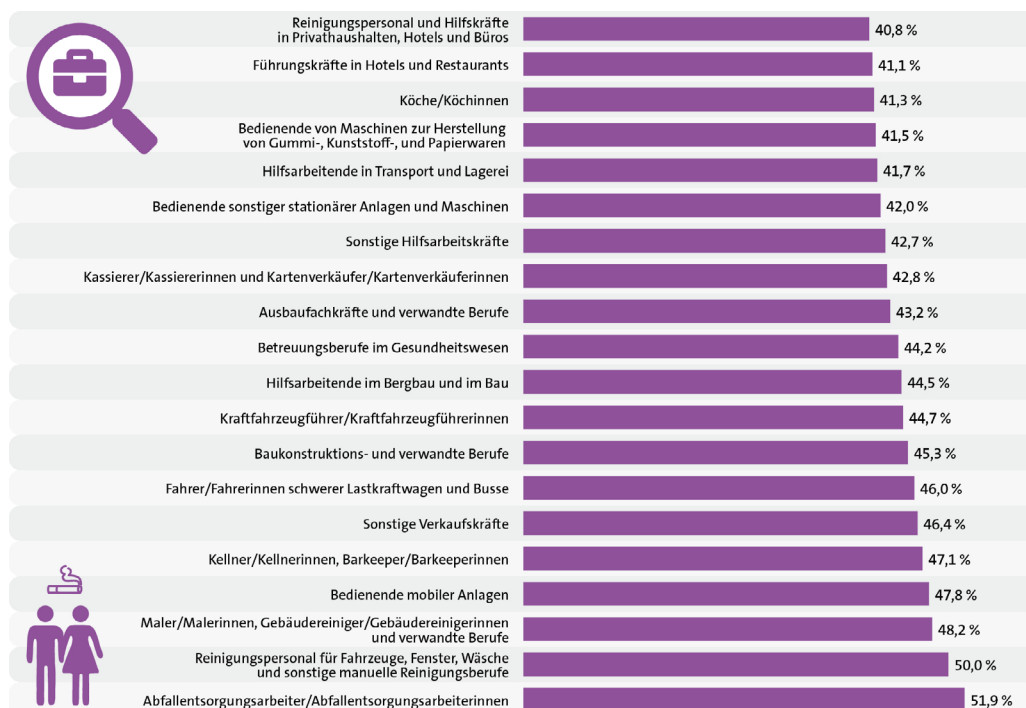
Abb. 3: Berufsgruppen mit den höchsten Anteilen von Rauchenden (mehr als 40 Prozent) | Daten: Mikrozensus 2013